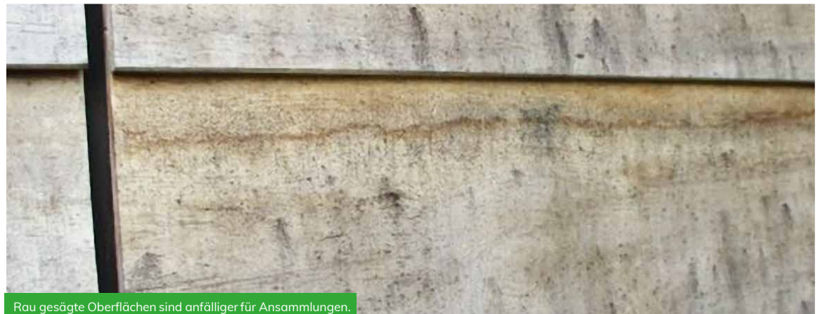
Rau gesägte Oberflächen sind anfälliger für Ansammlungen.

Während diese Oberflächewucherungen nicht selbst zum Verfall führen, sind sie oft mit dem Beginn des Pilzverfalls von Holz verbunden. Auf der ungiftigen Oberfläche von Accoya kann Schimmel wachsen, aber die Fäule, die die Unversehrtheit des Accoya beeinflussen könnte, beginnt damit nicht.