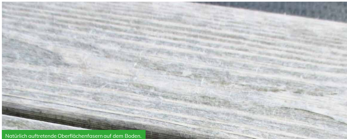
Natürlich auftretende Oberflächenfasern auf dem Boden.

Je höher die Menge oder die Intensität der UV-Oberfläche ist, desto schneller entwickelt sich dieser Prozess. Es ist anzumerken, dass diese Fasern auf allen exponierten Holzarten, einschließlich Accoya, insbesondere auf flachen Oberflächen, wie Böden gebildet werden. Ein geripptes Bodenprofil neigt dazu, diese Fasern anzusammeln, was es umso auffälliger macht.