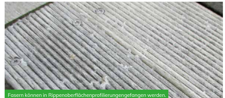
Fasern können in Rippenoberflächenprofilierungengefangen werden.

In all diesen Fällen ist die Haltbarkeit des Accoya Holzes in keiner Weise beeinträchtigt. Jedoch empfiehlt es sich, regelmäßig alle losen Fasern zu entfernen, da diese sich an einem Ort sammeln, wo sich dann Organismen niederlassen, was zur Verunstaltung des Holzes führen kann.